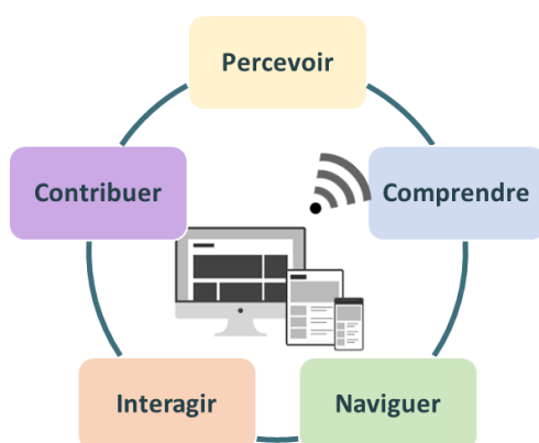
Schéma : Les 5 usages du numérique

L'accessibilité numérique est essentielle aux personnes en situation de handicap, et bénéficie aussi aux personnes âgées dont les capacités changent avec l'âge.