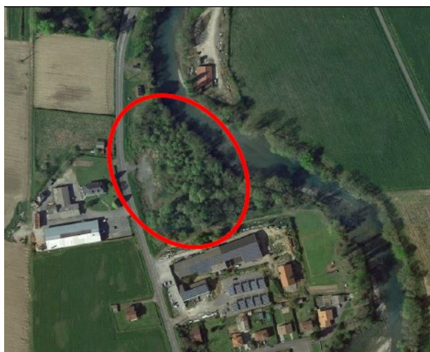
Vue aérienne du site concerné extrait du dossier soumis au présent avis