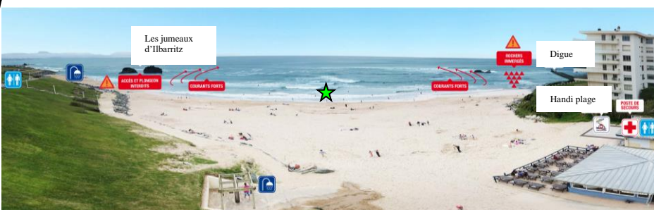
Schéma de la zone de baignade

Nom de la plage : Milady Commune : Biarritz Département : Pyrénées Atlantiques Région : Nouvelle Aquitaine Responsable Opérationnel : DGS Responsable Administratif : Maire Période d'Ouverture : Juin (du 13 au 30), Juillet, Août et Septembre (du 1er au 13 et 19, 20, 26, 27) 2020 Heures de surveillance : Juin (de 11h à 19h), Juillet et Août (de 10h30 à 19h30), Septembre (de 11h à 18h) Fréquentation : 3500 pers. / jours