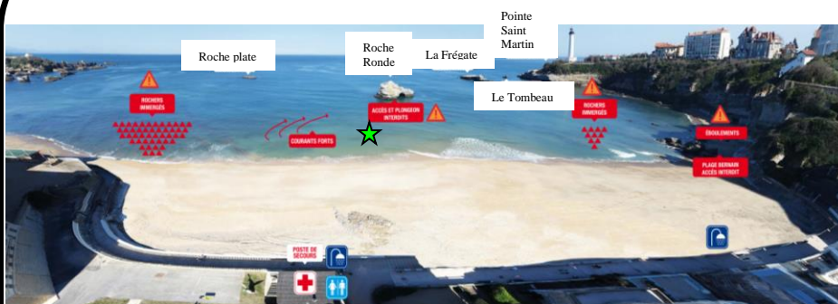
Schéma de la zone de baignade