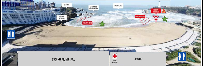
Schéma de la zone de baignade