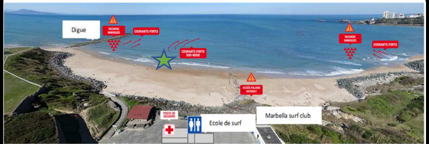
Schéma de la zone de baignade