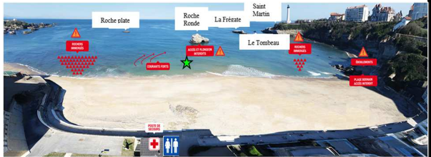
Schéma de la zone de baignade