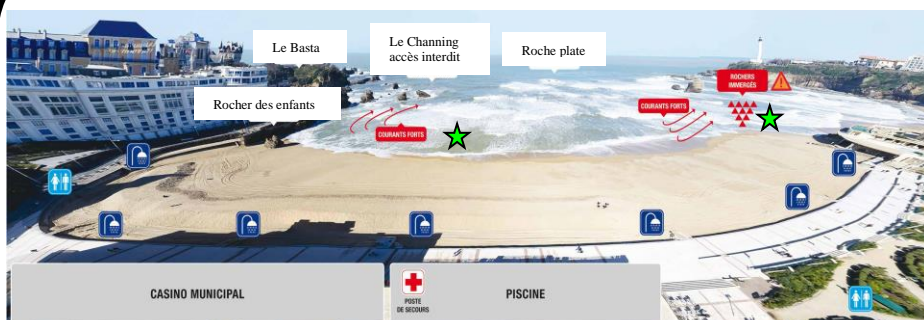
Schéma de la zone de baignade