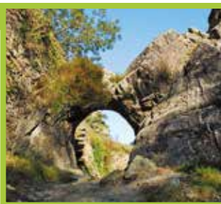
Le Pas de Roland

Le long d'un sentier muletier longeant les gorges d'Ateka et la Nive, un étroit passage taillé dans la roche relie la vallée à la ligne frontrière. Des légendes qui lui sont attachées, ce passage a gardé le nom de « Pas de Roland ». Pour certains, Roland, neveu de Charlemagne, se rendant à Roncevaux combattre les Sarrasins (en réalité les Basques), se heurta à un rocher infranchissable. Son épée « Durandal » qui ne le quittait jamais, permit à Roland de tailler un passage pour ses soldats qui purent ainsi poursuivre leur chemin. Pour d'autres, cette brèche dans la roche serait le résultat d'une ruade du cheval de Roland. Quelle que soit la légende, le superbe paysage vaut le détour.