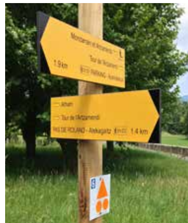
Signalétique des sentiers de randonnées

GRP®, GR® et PR® sont des marques déposées par la Fédération Française de Randonnée Pédestre. Certains itinéraires ont été sélectionnés par la Fédération Française de randonnée pédestre en fonction de critères de qualité, ils sont labellisés PR®.