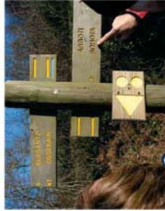
Une photo locale des sentiers ou balisage

Les itinéraires que nous vous proposons ont fait l'objet de la plus grande attention. Vos impressions et observations sur l'état de nos chemins, nous intéressent et nous permettent de les maintenir en état. Nous vous invitons à communiquer vos remarques en contactant l'office de tourisme précisé sur la fiche jointe. Vous pourrez vous y procurer une fiche d'observation Ecoveille®.