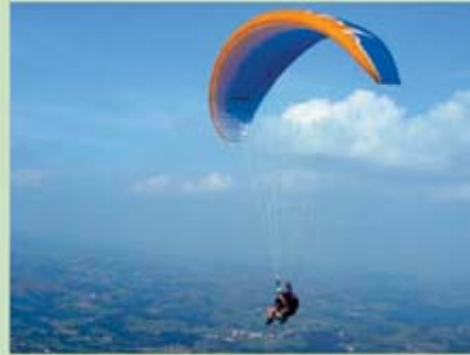
Vol en parapente

tracée dans la fougèraie qui domine une ancienne carrière. Puis à gauche entre les blocs.