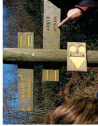
Une photo locale des sentiers ou balisage

Les itinéraires que nous vous proposons ont fait l'objet de la plus grande attention. Vos impressions et observations sur l'état de nos chemins, nous intéressent et nous permettent de les maintenir en état. Nous vous invitons à communiquer vos remarques en contactant l'office de tourisme précisé sur la fiche jointe. Vous pourrez vous y procurer une fiche d'observation Ecoveille®.