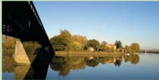
Pont Eiffel sur l'Adour

Circuit pour flâner sur les berges de l'Adour où la barthe forme un rideau de verdure derrière lequel se dissimulent de nombreux hôtes parfois protégés comme la petite tortue nommée cistude.