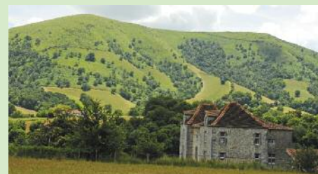
Château d'Olce au pied du Hoxa Handia

D u village l'itinéraire permet l'ascension du mont Hoxa Handi, un des petits sommets des Pyrénées basques. On peut y admirer un magnifique panorama. La descente rejoint un col nommé Hiru Haitzeta, les trois chênes. La présence de nombreuses cabanes indique qu'à l'automne, on chasse la palombe. Une belle piste mène au village en passant devant le château. Iholdy se caractérise par son église dotée d'un clocher-fronton. On y célèbre chaque année depuis la Seconde Guerre Mondiale la Fête-Dieu (Besta Berri), cérémonie religieuse haute en couleur avec sa procession costumée.