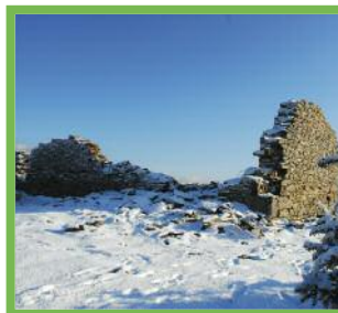
The ancient chapel of Olhain

La Capilla de Olhain se encuentra en medio de las ruinas de un reducto con forma pentagonal, en el que dos de los lados miden más de 25m (extraído del libro "Autrefois Sara" de J.Antz, ed. Atlantica 2005).