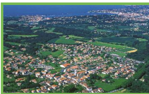
Vista aérea de Urrugne

En el centro del pueblo, podemos admirar la enorme iglesia de San Vicente, que tiene un reloj de sol en el que puede leerse el lema: «VULNERAT OMNES, ULTIMA NECAT» (todas hieren, la última mata). En la plaza, el ayuntamiento destaca entre las casas lapurdinas más bonitas del pueblo.