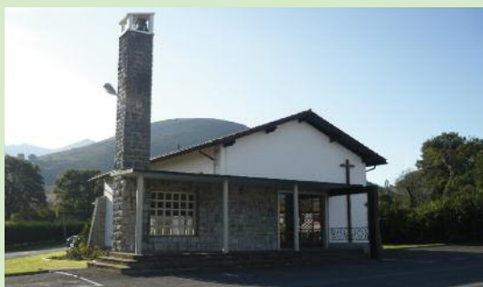
La capilla de Olhette

La ruta propuesta es un recorrido de ida y vuelta que comienza en la capilla de Olhette y finaliza en la venta de Intsola. Un paseo tranquilo por diferentes ambientes forestales para disfrutar en familia.