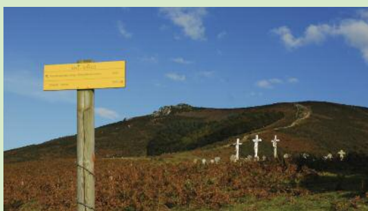
panorámica de las cruces del calvario

R uta que nos ofrece vistas panorámicas del océano, de las montañas del alrededor y de Ainhoa en numerosas ocasiones.