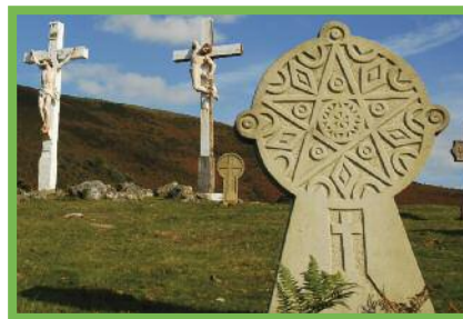
Estelas discoidales de la capilla del Aubépine.

En los cementerios del País Vasco, encontraremos estelas discoidales muy bonitas. Se trata de monumentos funerarios orientados de este a oeste como l'etxea (la casa vasca) o las iglesias romanas. Los elementos que aparecen gravados sobre las estelas responden a técnicas ancestrales, y son únicos en cada una de ellas, frutos de la inspiración y la sensibilidad del grabador. Con el tiempo, las criptas de mármol y granito coronadas por una cruz sustituyeron a este arte tradicional vasco. Sin embargo, actualmente, en los cementerios paisajísticos renacen estelas contemporáneas.