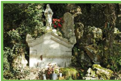
En el camino de Croix