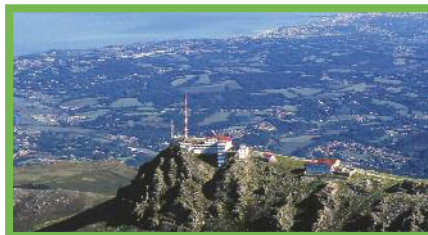
Cima del Larrún

El Larrún (Larrun en vasco) es un pico del País Vasco cuya cumbre está formada por acumulación de arenisca. Este macizo mide 905m y ofrece un magnífico panorama del océano y la montaña. En días despejados, pueden observarse hasta los pinares de las llanuras desde su cima. El Larrún es un punto alto de pastizales, tal y como lo atestiguan los numerosos cayolares (bordas) con tejados de lajas, los rebaños de ovejas y las manadas de pottoks. Para llegar hasta la cima del Larrún, podemos tomar un tren de cremallera que parte del collado de S. Ignacio.