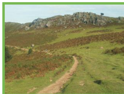
El sendero del Larrún

Quizás tengamos la ocasión de observar las golondrinas de las rocas protagonizando sus espectaculares acrobacias aéreas.