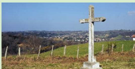
Le Calvaire au point n°3

Itinéraire intéressant pour la traversée du quartier Urguri remarquable par ses maisons labourdines. Les crêtes, aux points de vue panoramiques sur les vallées de St-Pée-sur Nive et de Sare, la présence de la Nive, et des landes pastorales ajoutent du charme à cette randonnée.