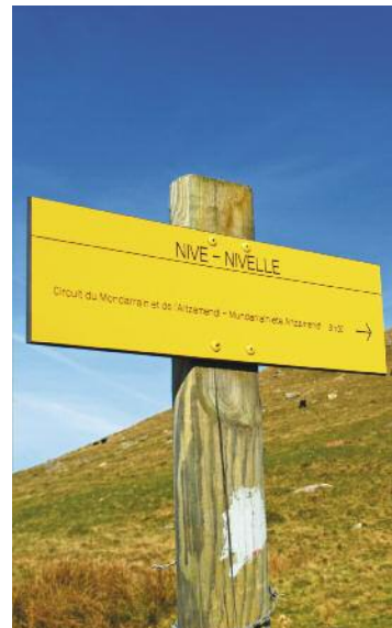
Une photo locale des sentiers ou balisage

Durée de la randonnée : La durée de chaque circuit est donnée à titre indicatif. Elle tient compte de la longueur de la randonnée, des dénivelées et des éventuelles difficultés.