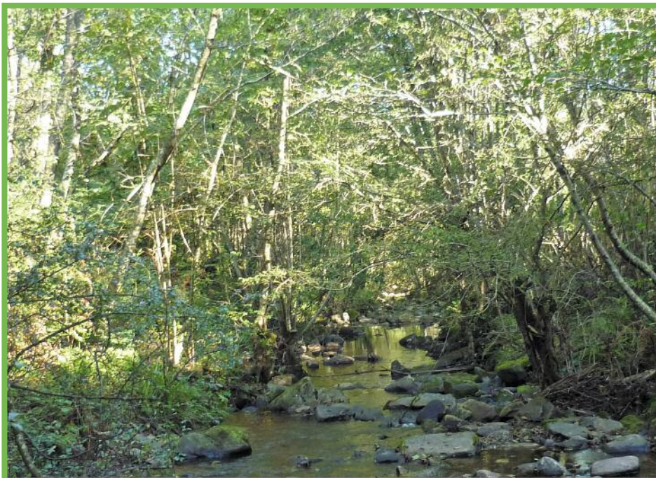
Le ruisseau Intsola

ruisseau : l'itinéraire emprunte une partie du GR®10. Suivre le chemin jusqu'à l'arrivée aux ventas d'Intsola ② 607992-4796505. Prendre le même chemin pour le retour.