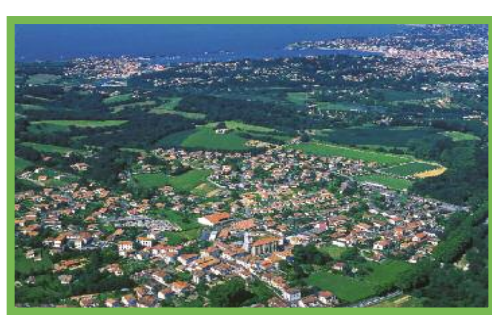
Urruña, airetik hartua.

Lapurdiko herri bat, ozeanoaren eta Pirinioetako katearen bukaeraren artean. Urruña bost mila hektareetara zabaltzen da Larrun eta Zokoaren artean. Herriaren sartzean Urtubia gazteluak, auzoetako ibarren bazterrean kokatua denak, kokapen estratregikoa du. Herri barnean, San Bixintxo elizak eguzki-ordulariaren gainean ondoko atsotitza aurkezten du : «VULNERAT OMNES, ULTIMA NECAT » (oren guzietatik zauritzen dute, azkenekoak hiltzen du) .Plazan, Herriko etxea ikus daiteke, herri barneko lapurtar estiloko etxeetarik ederrenetako bat.