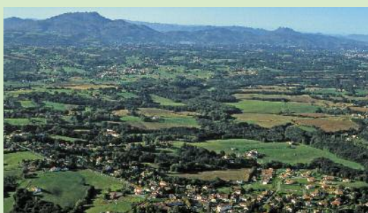
Arbona, airetik hartua

I bilbide atsegin horretan, pentzeak eta oihanpeak ikus daitezke. Landaredia- ren izadiak erakusten du ur aintz badela lur-zoluan.