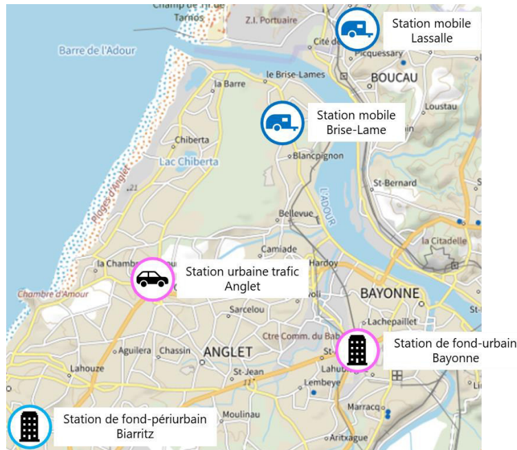
Figure 2 : Implantation des stations mobiles et des stations fixes de surveillance de la qualité de l'air